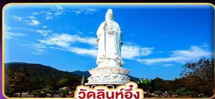
วัดลิ้นห้อย