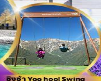
ชิงช้า Yoo hoo! Swing