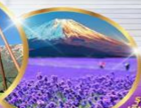
โออิชิ ปาร์ค