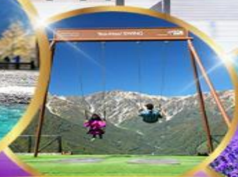
ชิงช้า Yoo hoo! Swing