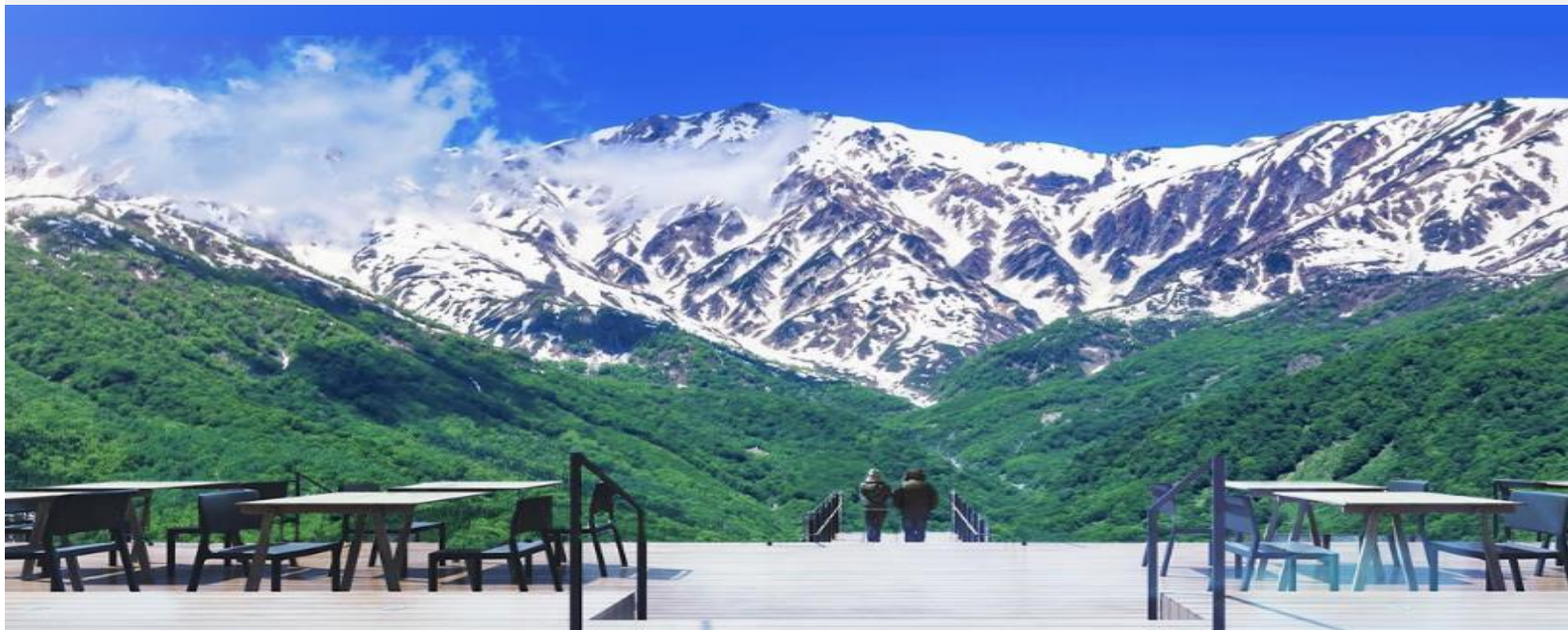
HAKUBA MOUNTAIN HARBOR

ไม่พลาดกับการ ชมวิวแบบพาโนรามา ณ Hakuba Mountain Harbor ด้วยทัศนียภาพที่เหนือ ชั้นของภูเขาโดยรอบ จุดเด่น คือ ระเบียง “Hakuba Sanzan” ที่สามารถเห็นเทือกเขาแอลป์แบบ 360 องศา ได้อย่างสวยงามในทุกฤดู สามารถยืนถ่ายรูป และดื่มด่ำกับบรรยากาศได้อย่าง เต็มอิม ในบริเวณเดียวกันยังมีร้านเบเกอรี่ โดยทางเข้ามีที่นั่งบนระเบียง สามารถเพลิดเพลิน ไปกับการจิบเครื่องดื่มอุ่น ๆ พร้อมชมบรรยากาศตามอัธยาศัย