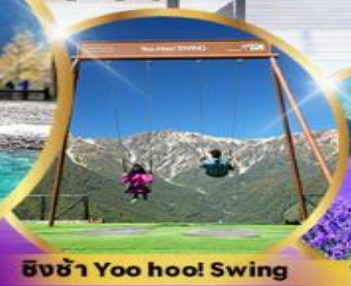
ชิงช้า Yoo hoo! Swing