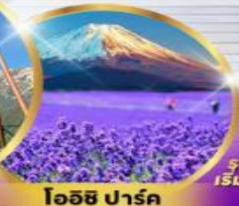
โอฮิชิ ปาร์ค