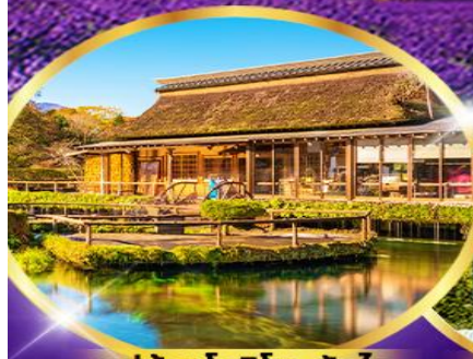
หมู่บ้านโอชิโนะ อักโท

อิสระท่องเที่ยว 1 วันเต็ม "วันอิสระเลือกซื้อ Tokyo Disney"