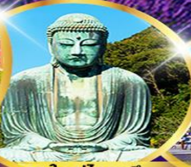
พระใหญ่โตบุทสึ