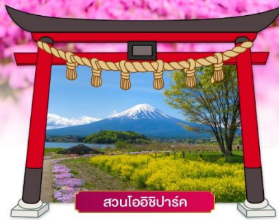
สวนโออิชิปาร์ค