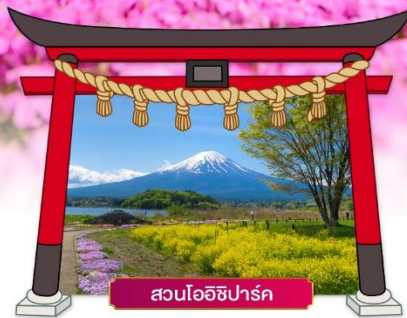
สวนโออิชิปาร์ค