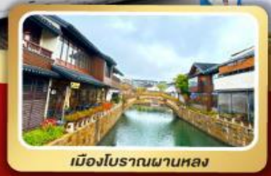
เมืองโบราณผานหลง