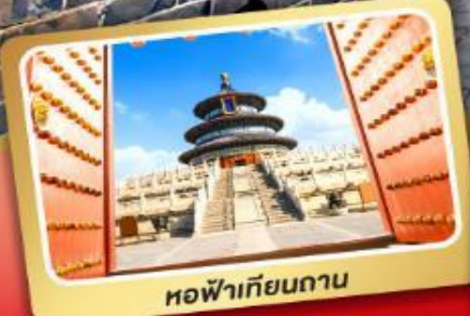
หอฟ้าเทียนกาน