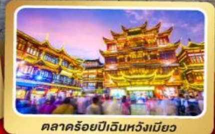
ตลาดร้อยปีเจินหวงเมี่ยว