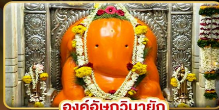
องค์อชฏินายก