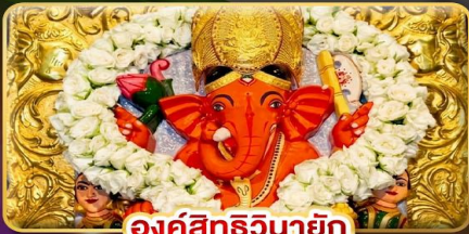
องค์สิทธินายก