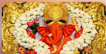
องค์สิทธิวินายัก