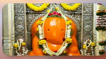
องค์อัยกวิณายัก