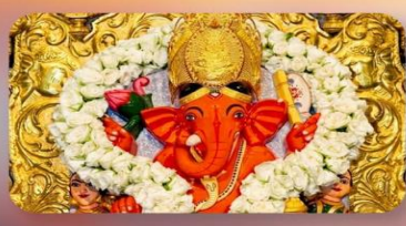
องค์สิทธิวินายัก