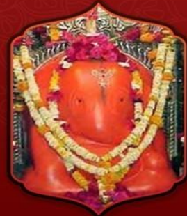
องค์ศรีจินดามณี

ทำให้ท่านสมหวังดังได้อธิษฐาน ต่อลูกแก้วจินดามณี