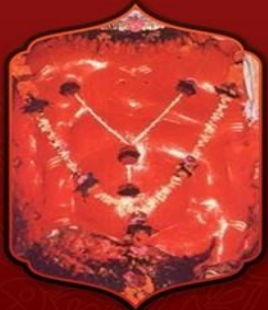
องค์ศรีศรีจัตมา

ทำให้ท่านขอบุตรได้ และจะได้บุตรที่ดีมีปัญญาหลักแหลม