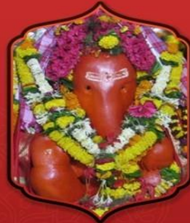
องค์ศรีวรรตวินายก

ทำให้ท่านจะให้หายป่วยจากโรคภัยไข้เจ็บ ทั้งปวงและทำให้สุขภาพแข็งแรง