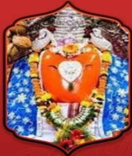
องค์ศรีบัลลาลศวา

ทำให้ท่านได้รับพรทุก ๆ อย่าง ที่ขอจากองค์พระพืชมงคล