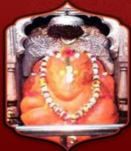
องค์ศรีมหาคณปตี