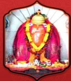
องค์ศรีวิขเนศวา

ผู้ขจัดอุปสรรคและกั้นอันตราย ทำงานได้สำเร็จราบรื่น ไร้อุปสรรค