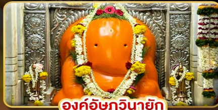
องค์อชฏินายก