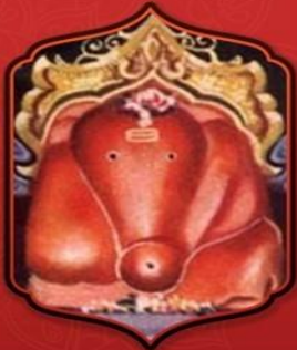
องค์ศรีสิทธิวินายก

ทำให้ท่านประสบความสำเร็จ ในเรื่องงานราบรื่นทุกประการ