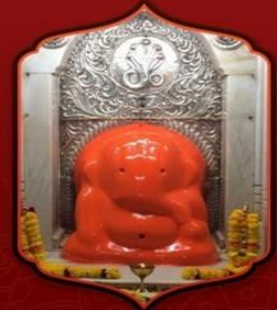
องค์ศรีโมเรศวา

ทำให้ท่านชีวิตปราศจาก อุปสรรคและอันตรายใดๆทั้งปวง