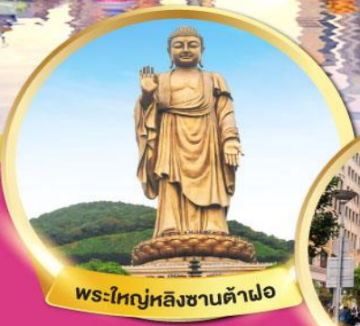
พระใหญ่หลังซานต้าฟอ