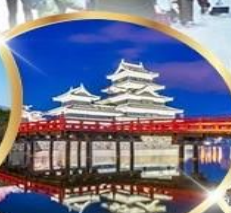
ปราสาทมัตสึโมโตะ