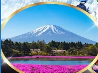
ฟูจิซึบะซากุระ