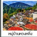
หมู่บ้านหวงหลิ่ง