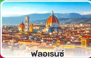
ฟลอเรนซ์