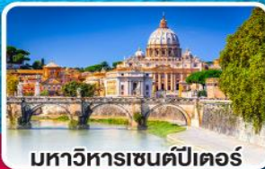
มหาวิหารเซนต์ปีเตอร์