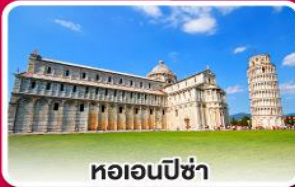
หอเอนปิซ่า