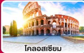
โคลอสเซียม

ลิ้มรสพาสต้า พิซซ่า และสปาเก็ตตี้ แบบต้นตำหรับอิตาลี