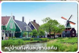
หมู่บ้านกังหันลมชาวนสคัน