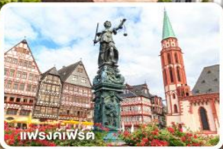
แฟรงค์เฟิร์ต