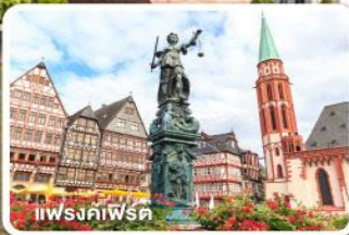
แฟรงค์เฟิร์ต