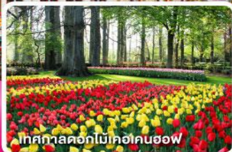
เทศกาลดอกไม้เคอเคนฮอฟ