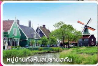
หมู่บ้านกังหันลมซานสคัน