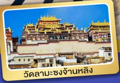
วัดลามะซงจ้านหลิง