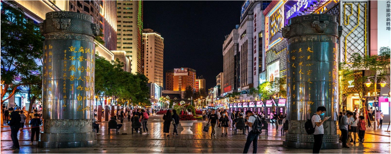
云 茶 旅 游 新 胜 地

ในคุณหมิง ถนนจินปี้ลู่ ตั้งอยู่ใจกลางเมืองคุณหมิง ความพิเศษของสถานที่แห่งนี้คือ ตอนกลางของถนนมีซุ้มประตูม้าทองและซุ้มประตูไถ่กรรมกรต ซึ่งภาษาจีนเรียกว่าจินหม่าและปี้จี จึงเอาคำย่อ “จินปี้” มาขนานนามถนนว่าจินปี้ลู่ซึ่งก็คือ “ถนน(ม้า)ทอง(ไถ่)กรรมกรต”