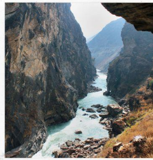
ช่องแคบเสือกระโดด