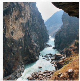
ช่องแคบเสือกระโดด