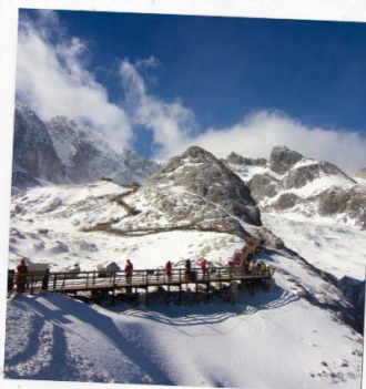
ภูเขาหิมะมังกรหยก