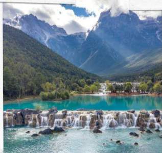
หุบเขาพระจันทร์สีน้ำเงิน