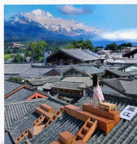
FAN KOO CAFE