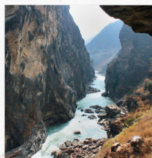
ช่องแคบเสือกระโดด