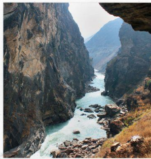
ช่องแคบเสือกระโดด