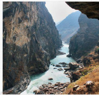
ช่องแคบเสือกระโดด