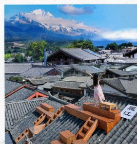
FAN KOO CAFE