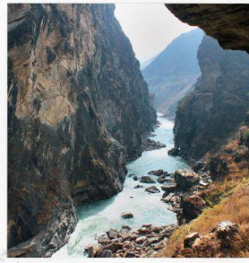
ช่องแคบเสือกระโดด