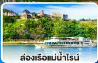
ล่องเรือแม่น้ำไรน์