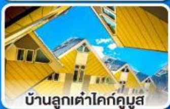
บ้านลูกเต่าโคกคูมุส

ล่องเรือ... ชมทัศนียภาพอันสวยงาม ตลอดสองฟากฝั่งของแม่น้ำไรน์