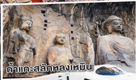
ถ้ำแกะสลักหลงเหมิน