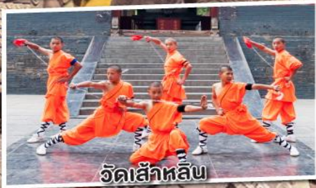
วัดเส้าหลิน