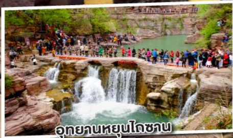
อุทยานหยุนโถซาน