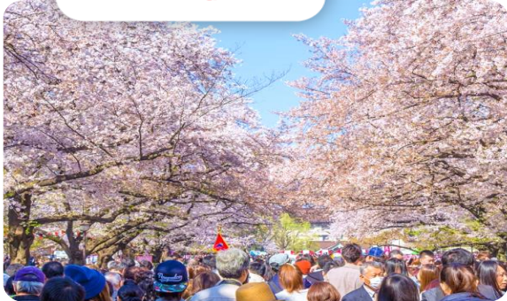
โปรแกรมเดินทาง 5 วัน 4 คืน THAI LION AIR