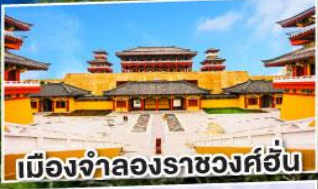
เมืองจำลองราชวงศ์ฮั่น