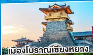
เมืองโบราณเชียงหยาง