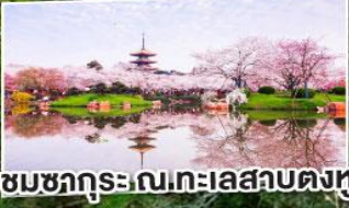
ชมซากุระเลนทะเลสาบตงหู