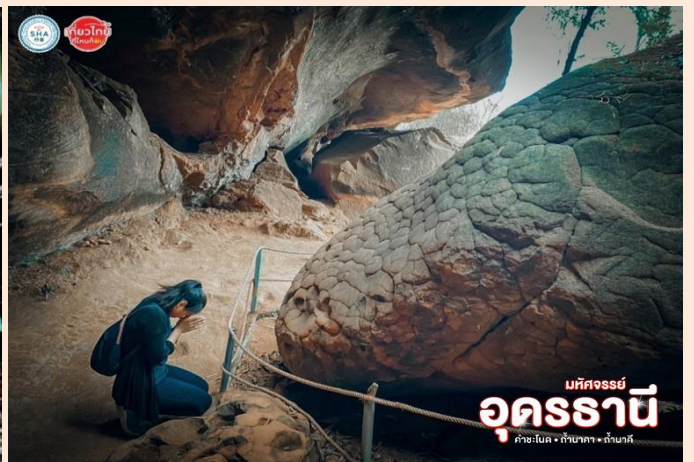
SHA เที่ยวไทย ปลอดภัย มหัสจรรย์ อุดรธานี คำชะโนด • ถ้ำนาคา • ถ้ำบาศิ