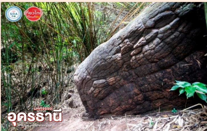
SHA เที่ยวไทย ปลอดภัย มหัสจรรย์ อุดรธานี คำชะโนด • ถ้ำนาคา • ถ้ำบาศิ