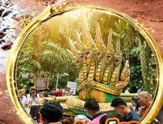
ปากชะโนด