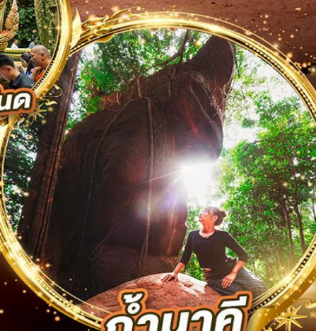
ถ้ำนาคคิ