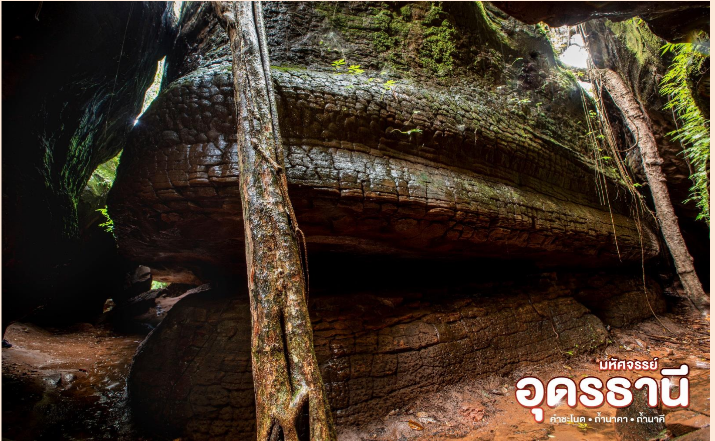
มหัสจรรย์ อุดรธานี คำชะโนด • ถ้ำนาคา • ถ้ำบาศิ