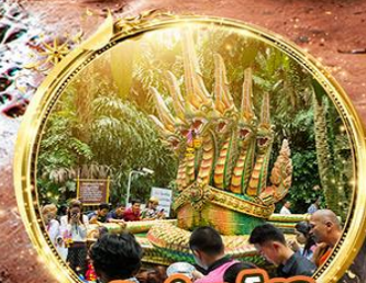
ปากคำชะโนด