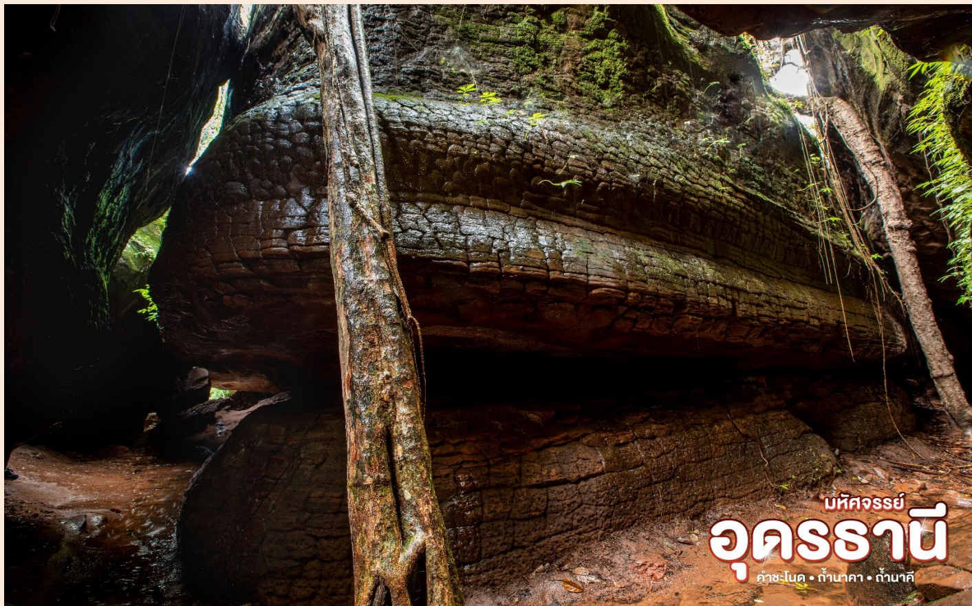
มหัสจรรย์ อุดรธานี ฟ้าชะโนด • ถ้ำนาคา • ถ้ำบาศิ