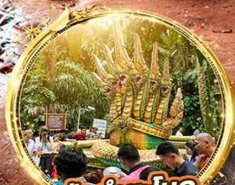
ปากำชะโนด