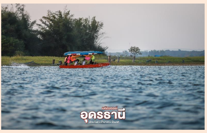
นำท่าน ล่องเรือบึงโขงหลง ไหว้ขอพรปู่อ้อลือ วังปู่เจ้าอ้อลือนาคราช ณ เกาะคอนโพธิ์