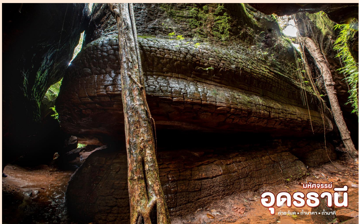
มหัศจรรย์ อุดรธานี คำชะโนด • ถ้ำนาคา • ถ้ำบาศิ