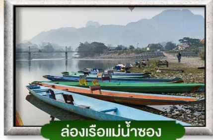
ล่องเรือแม่น้ำซอง