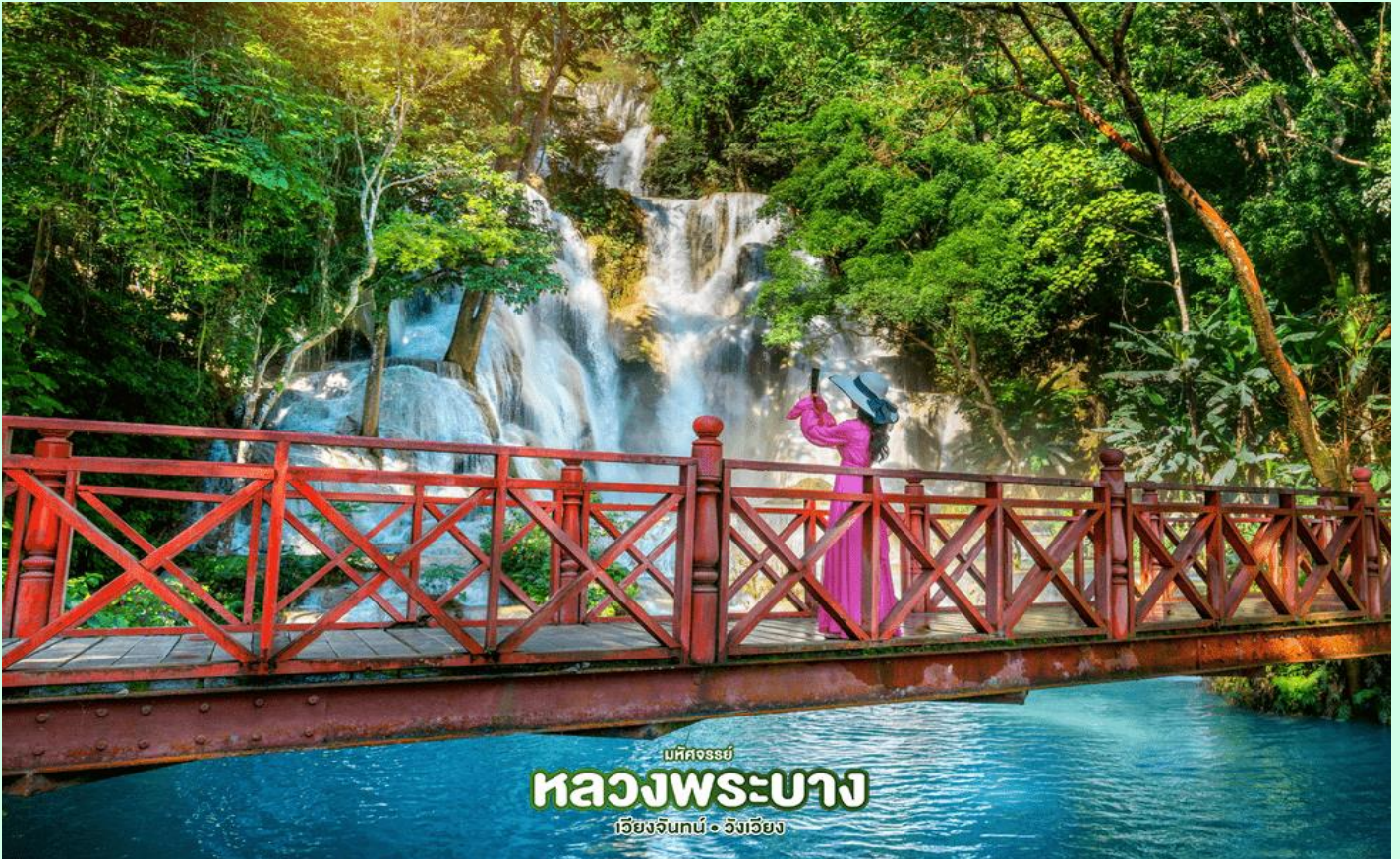
มหัสจรรย์ หลวงพระบาง เวียงจันทน์ • ฝั่งเวียง

จากนั้น นำเดินทางผ่านหมู่บ้านชนบทชมวิถีชีวิตของชาวบ้านสู่ น้ำตกตาดวางสี (Kuang Xi Waterfall) โดยผ่านหมู่บ้านชนบทริมถนน 2 ข้างทาง เป็นหนึ่งในน้ำตกที่สวยงามที่สุดในเขตหลวงพระบาง มีแม่น้ำใสสีมรกตตลอดปี ชมความงามของน้ำตกที่ตกลงหล่นเป็นชั้นๆอย่างสวยงาม มีสะพานและเส้นทางเดินชมรอบๆ น้ำตก ใช้เวลาอิสระดื่มด่ำกับธรรมชาติ และ อิสระกับการเล่นน้ำ