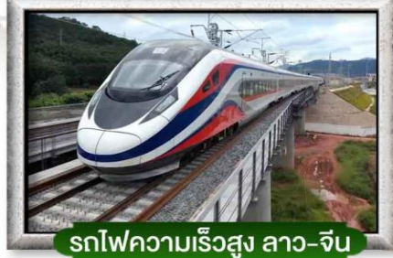
รถไฟความเร็วสูง ลาว-จีน