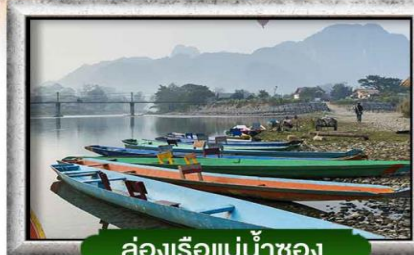
ล่องเรือแม่น้ำซอง