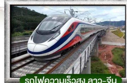
รถไฟความเร็วสูง ลาว-จีน