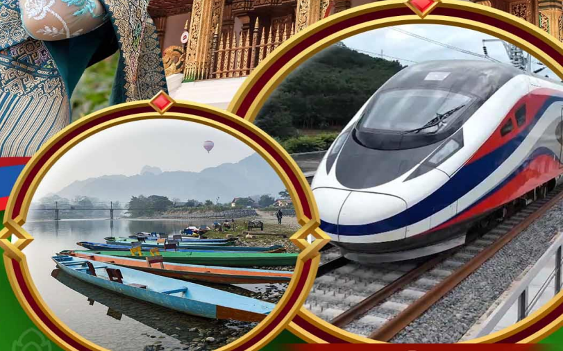
ล่องเรือแม่น้ำซอง