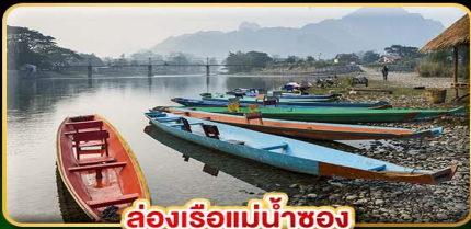
ล่องเรือแม่น้ำซอง