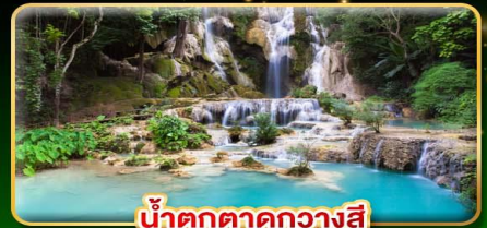
น้ำตกตาดกวาสี