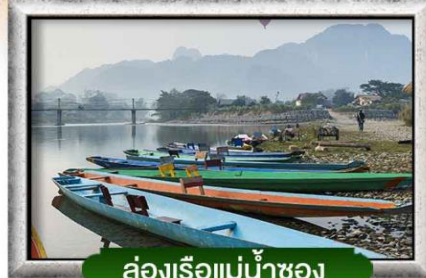
ล่องเรือแม่น้ำซอง