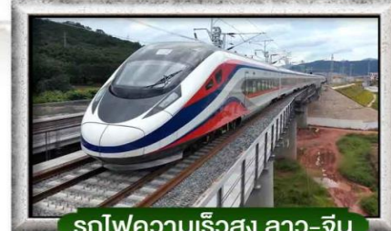
รถไฟความเร็วสูง ลาว-จีน