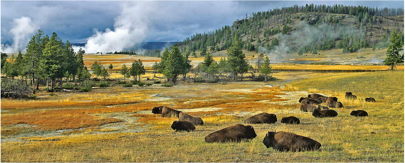
ใกล้เคียง