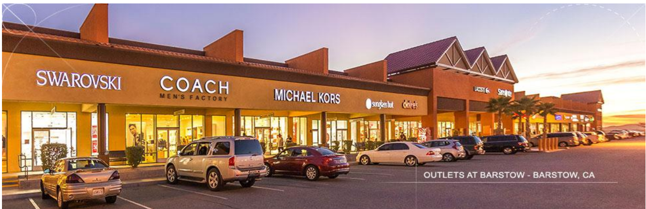
OUTLETS AT BARSTOW - BARSTOW, CA

มีสินค้าหลากหลายแบรนด์ให้ท่านได้เลือกซื้อ อาทิ OASICS, Bally, Banana Republic, Calvin Klein, Coach, Gap, Guess Factory, Kate Spade, Kipling, Lacost, Samsonite, Swarovski, Tommy Hilfiger เป็นต้น ได้เวลาอันสมควร นำท่านเดินทางสู่ ลอสแอนเจลิส (ระยะทาง 175 กม. ระยะเวลาในการเดินทางประมาณ 1 ชั่วโมง 50 นาที)