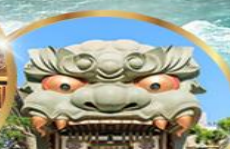
ศาลเจ้านิมะ ยาชากะ

ราคา 37,919 บาท เดี่ยว รวมภาษีมูลค่าเพิ่ม 7%