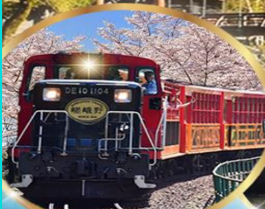
รถไฟสายโรแมนติก