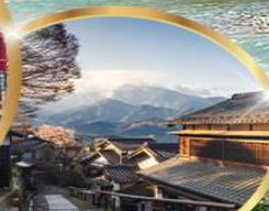
มาโกเมะจุกุ