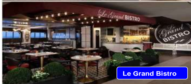
Le Grand Bistro