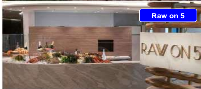
Raw on 5