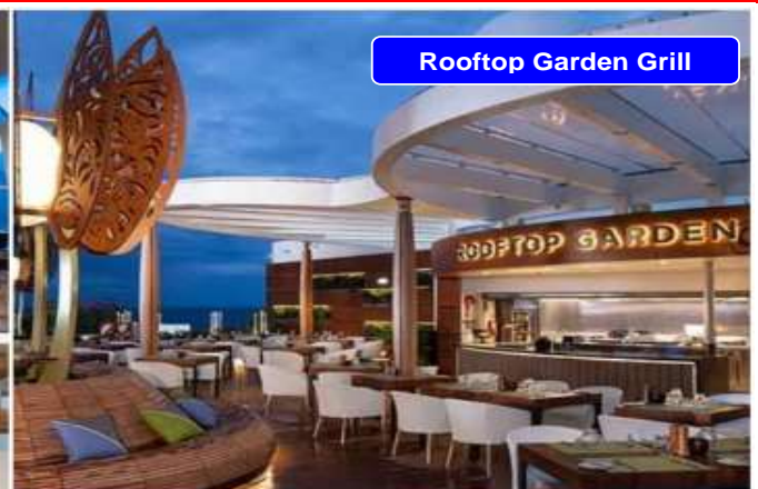
Rooftop Garden Grill