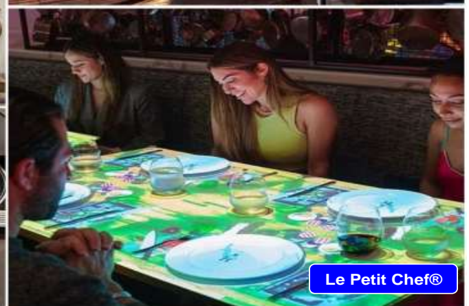
Le Petit Chef®