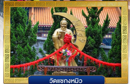
วัดแซงทมิว