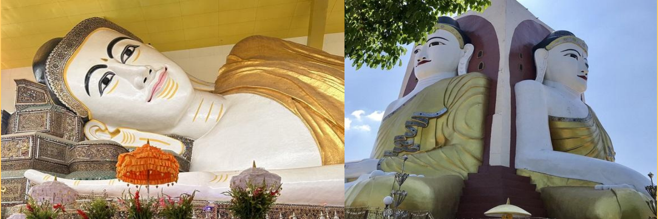
จากนั้นนำท่านนั้สการ พระพุทธรูปไสยาสน์ชเวตาเลียวหรือพระนอนยืมหวาน ซึ่งเป็นพระนอนที่งดงามที่สุด ของเมืองหงสาวดี อีกทั้งยังสามารถเลือกซื้อของฝาก อาทิ ไม้แกะสลัก ผ้าปักพื้นเมือง ผ้าพื้นเมือง เป็นของฝากคนทางบ้าน

เช้า รับประทานอาหารเช้า ณ ห้องอาหารของโรงแรม หลังอาหารเช้าออกเดินทางกลับโดยรถบรรทุกหกล้อถึงคินปูนแคมป์เปลี่ยนเป็นบัสปรับอากาศเดินทางสู่ เมืองหงสาวดี ใช้เวลาเดินทางประมาณ 2-3 ชั่วโมงซึ่งเป็นเมืองหลวงเก่าแก่ของอาณาจักรมอญโบราณที่มีอายุเก่าแก่กว่า 400 ปี ชมวัดและโบราณสถานที่สำคัญในหงสาวดี จากนั้นชม พระเจดีย์ไจ้ปูน ซึ่งบูรณะเมื่อ พ.ศ. 2019 มีพระพุทธรูปปางประทับ นั่งโดยรอบทิศประกอบด้วยสมเด็จพระสมณโคดมสัมมาสัมพุทธเจ้า (ผินพระพักตร์ไปทางทิศเหนือ) กับพระพุทธรูปเจ้าในอดีต 3 พระองค์ คือ พระพุทธรูปเจ้าโกนาคัม (ทิศใต้) พระพุทธรูปเจ้ากุกสันธะ(ทิศตะวันออก)และพระพุทธรูปเจ้ามหากัสสะปะ(ทิศตะวันตก)สร้างโดยสี่สาวพี่น้องที่อุทิศตนให้กับพระพุทธรูปสร้างพระพุทธรูปแทนตนเองและสาบานตนไม่ข้องแวะกับบุรุษเพศ