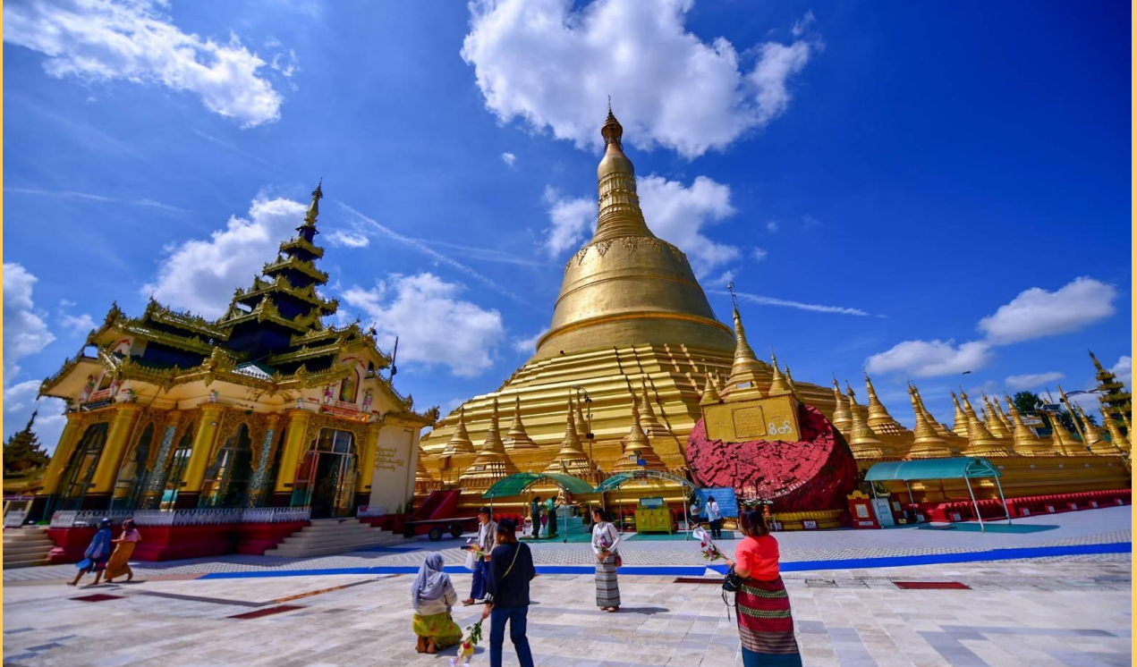
นำคณะเดินทางสู่ เมืองไจ้กัทโย (Kyaikhtyo) ใช้เวลาเดินทางประมาณ 2-3 ชั่วโมง

จากนั้นนำท่านเดินทางสู่ เมืองหงสาวดี(BAGO) ซึ่งอยู่ห่างจากย่างกุ้งประมาณ80กม.(ใช้เวลาเดินทางประมาณ 1.30-2ชั่วโมง) จากนั้นนำท่านนมัสการ เจดีย์ชเวมอดอร์ (ShwemawdawPagoda) คนไทยนิยมเรียกว่า พระมหาเจดีย์มตะ ซึ่งเป็นเจดีย์ ใหญ่คู่บ้านคู่เมืองที่สูงที่สุดของหงสาวดีและยังเป็นที่เคารพสักการะของชาวมอญและพม่ามาช้านาน แล้วนำท่านชม พระราชวัง บุเรงนอง ซึ่งเพิ่งเริ่มขุดค้นและบูรณะปฏิสังขรณ์เมื่อปี 2533 จากซากปรักหักพังที่ยังหลงเหลืออยู่ทำให้สันนิษฐาน ได้ว่าโบราณสถานแห่งนี้เป็นพระราชวังของพระเจ้าหงสาวดีบุเรงนองปัจจุบัน