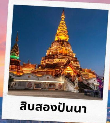
สิบสองปันนา