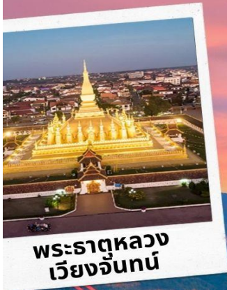
พระธาตุหลวง เวียงจันทน์