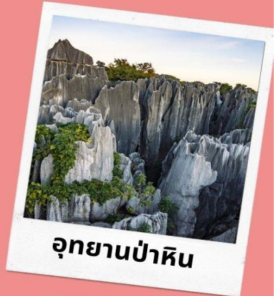
อุทยานป่าหิน