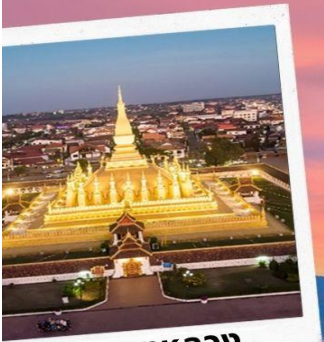
พระธาตุหลวง เวียงจันทน์