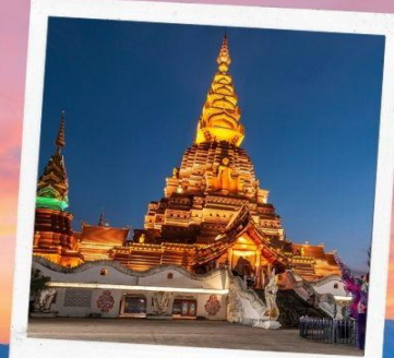
สิบสองปันนา