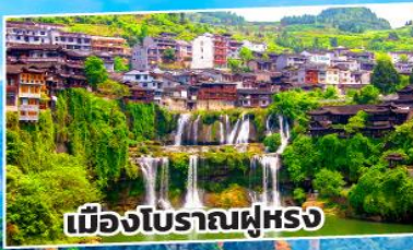
เมืองโบราณฝูหรง