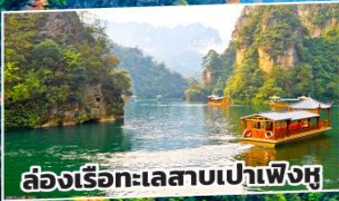
ล่องเรือทะเลสาบเป่าเฟิ่งหู