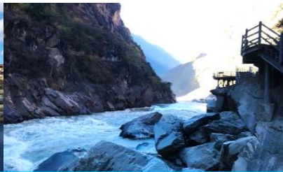
ช่องแคบเลือกระโจน