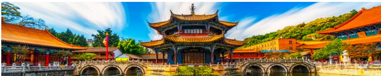
วัดหยวนทง

วันที่หก คุนหมิง – วัดหยวนทง - กรุงเทพฯ (ดอนเมือง)