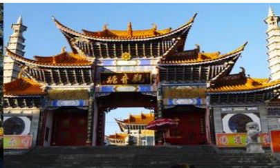
วัดเจ้าแม่กวนอิมแปลงกาย