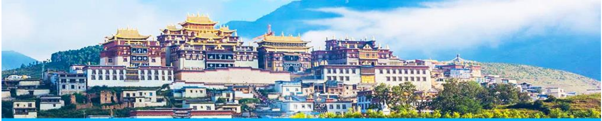
เมืองโบราณแซงกริล่า

จากนั้นนำท่านชม หมู่บ้านชีโจวหรือหมู่บ้านชาวไป๋ ชนพื้นเมืองที่สำคัญของเมือง ชมการแสดงของชนชาติป๋ายพร้อมชิมชาสามแก้ว เพื่อรำลึกถึงวิถีชีวิตและการเกิดมาเป็นมนุษย์ของตนเอง ซึ่งถือเป็นเอกลักษณ์ของชนชาวไป๋ ที่หาดูได้ยาก