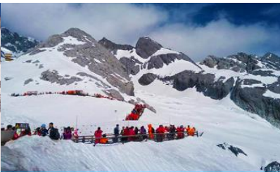
ภูเขาหิมะมังกรหยก