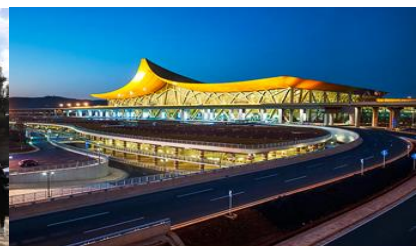
สนามบินเมืองคุนหมิง

วันที่ห้า เมืองต้าหลี่ – เมืองคุนหมิง-วัดหยวนทง-เมืองโบราณกวนตุ๋- KUNMING WATERFALL PARK