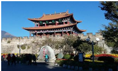
เมืองโบราณต้าหลี่