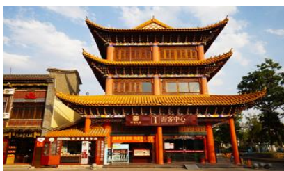
เมืองโบราณกวนตุ๋

พักที่ FEI LONG HOTEL ระดับ 4 ดาว หรือเทียบเท่าในเมืองต้าหลี่