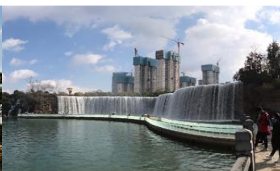
สวนน้ำตก Kunming Waterfall Park