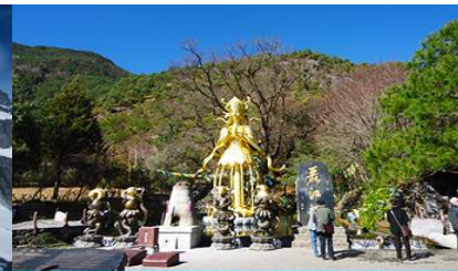
อุทยานน้ำหยก