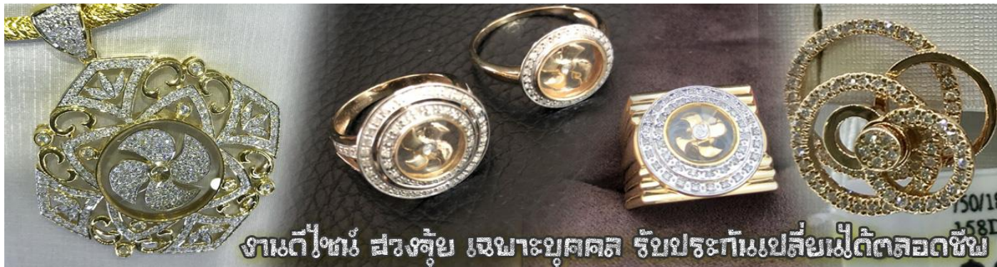
งานดีไซน์ สวยล้ำ เฉพาะบุคคล รับประกันเปลี่ยนฟรีตลอดชีพ

นำท่านเยี่ยมชม โรงงานจิวเวลรี่ ที่ขึ้นชื่อของฮ่องกงพบกับงานดีไซน์ที่ได้รับรางวัลอันดับยอดเยี่ยม และใช้ในการเสริมดวงเรื่อง ฮวงจุ้ยนำความโชคดี มั่งคั่งแก่ผู้สวมใส่ ซึ่งในเมืองไทยก็ได้นิยมแพร่หลายออกไป ไม่ว่าจะเป็นกลุ่ม ดารา นักการเมือง พ่อค้าแม่ขายที่ประกอบธุรกิจ เจ้าของกิจการห้างร้านต่าง ๆ ซึ่งเชื่อกันว่าจะนำสิ่งดี ๆ บัดเป่าสิ่งชั่วร้ายให้กับบุคคลที่สวมใส่ ซึ่งจะมีมากมายหลายชนิด เช่น จี้กั๊กหัน แหวนรุ่นต่าง ๆ นาฬิกาข้อมือ (ซึ่งผู้สวมใส่จะได้รับการดูลายมือจากซินเซปประจำร้าน เพื่อนำวิธีการเสริมดวงในการสวมใส่โดยไม่ติดต่อบริการ)