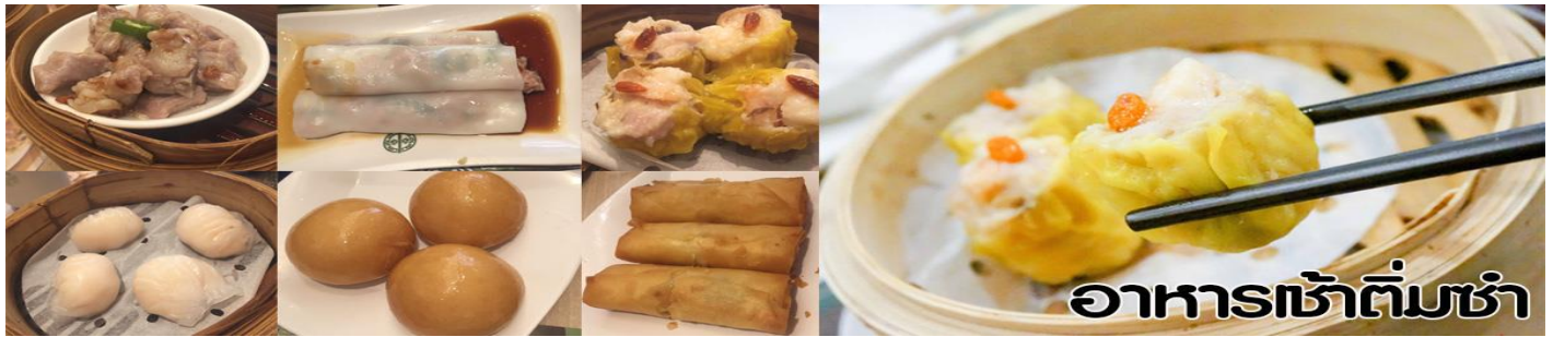
อาหารเช้าต้มซ่า

นำท่านเที่ยวเกาะฮ่องกง หนึ่งในแหล่งท่องเที่ยวยอดนิยมหาดทราย Repulse Bay หาดทรายรูปจันทร์เสี้ยวแห่งนี้สวยที่สุดแห่งหนึ่ง และยังใช้เป็นฉากในการถ่ายทำภาพยนตร์ไปหลายเรื่องมีรูปปั้นของเจ้าแม่กวนอิม และเจ้าแม่กิมทิวซึ่งทำหน้าที่ปกป้องคุ้มครองชาวประมง โดดเด่นอยู่ท่ามกลางสวนสวยที่ทอดยาวลงสู่ชายหาด ให้ท่านสัมผัสการขอพรจาก เจ้าแม่กวนอิม และเทพเจ้าแห่งโชคลาภเพื่อเป็นสิริมงคล ชำระสะพานต่ออายุซึ่งเชื่อกันว่าข้ามหนึ่งครั้งจะมีอายุเพิ่มขึ้น 3 ปี จนกว่าถึงเวลานัด