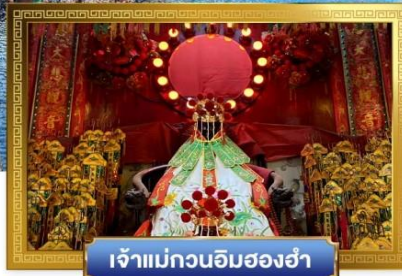
เจ้าแม่กวนอิมฮ่องฮ่า