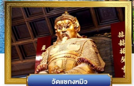
วัดเขangkงทมิว