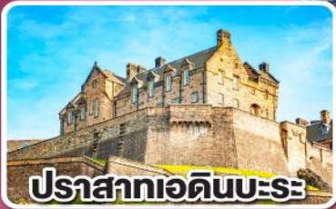
ปราสาทเอดินบะระ