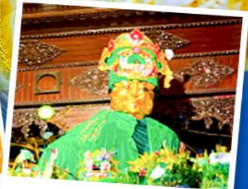
ขอพรมแม่ยักษ์