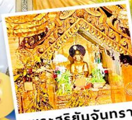
พระสุริยันจันทร