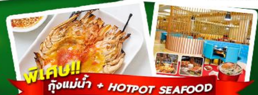
พิเศษ!! ก๊อแม่่น้ำ + HOTPOT SEAFOOD