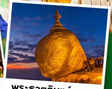
พระธาตุอินทร์แขวน