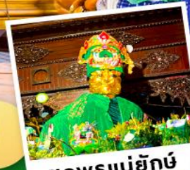
ชอพรแม่ยักย์