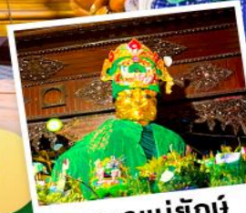
ซอพรแม่ยักย์