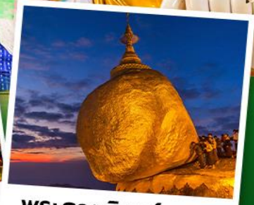
พระธาตุอินทร์แขวน